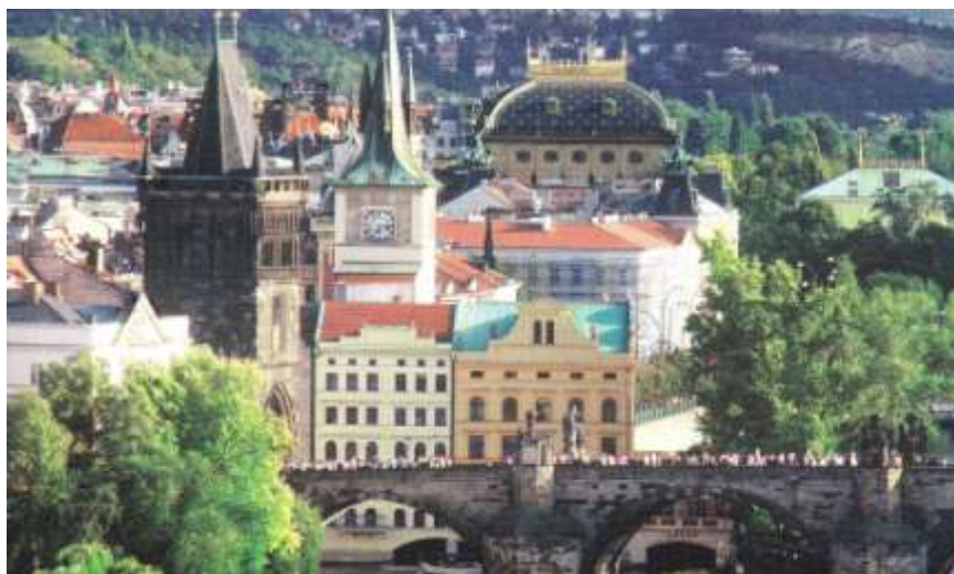
カレル橋と国民劇場(プラハ)